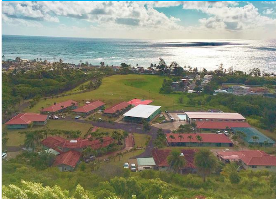
広大なキャンパス