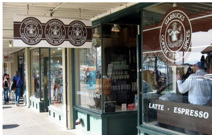
スターバックス 1号店