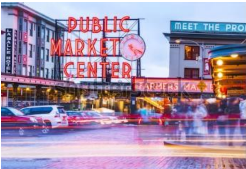
パイク・プレイス・マーケット