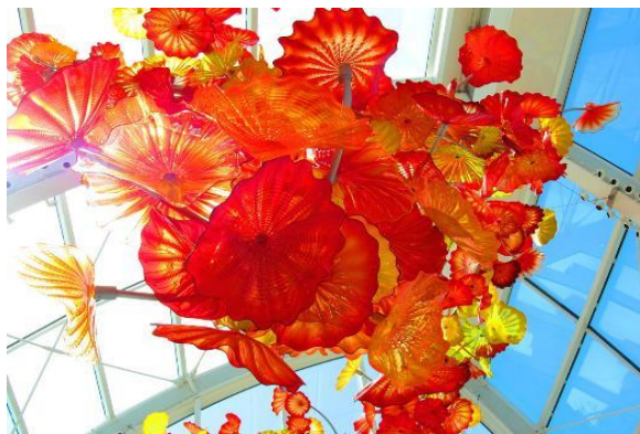
チフーリガーデン&ガラス