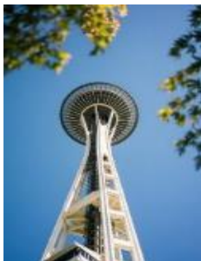
スペース・ニードル